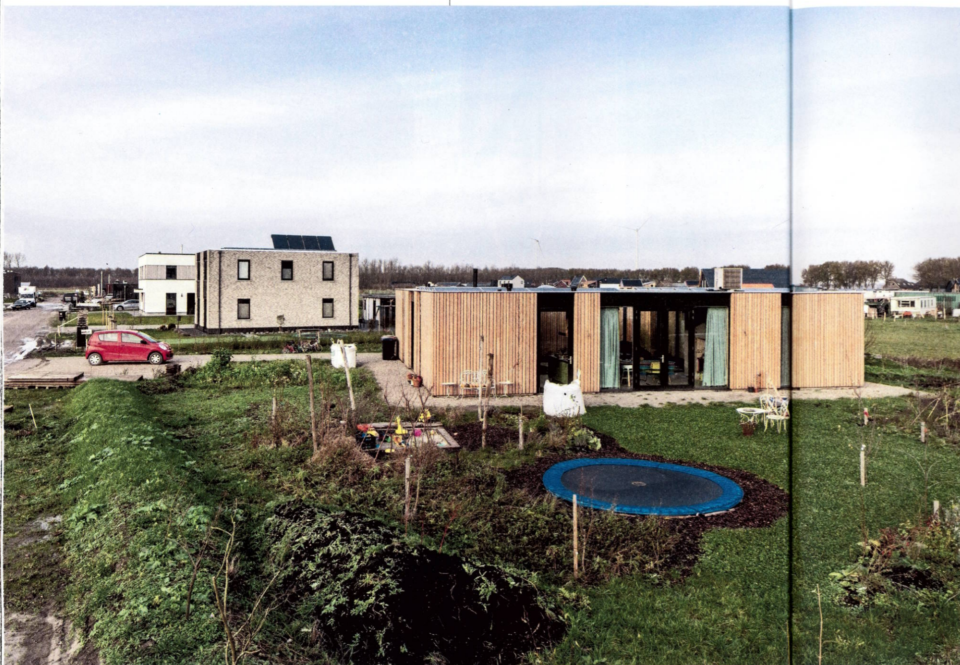
De patiowoning van Leontien Cremers en haar gezin.

De kinderen vissen in de vijver die als waterbuffer is aangelegd